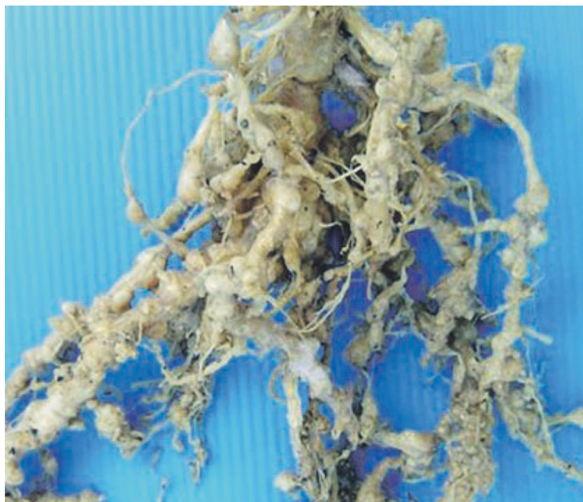
CNR ISPSP A sinistra Clamidospore del fungo endofita Pochonia chlamydosporia su radice di pomodoro Accanto, alterazioni istologiche galle e deformazioni prodotte da nematodi fitoparassiti galligeni su radici di pomodoro